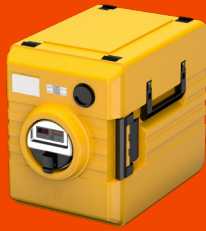
thermoport® 1000 KB