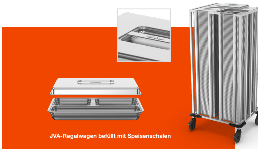
JVA-Regalwagen befüllt mit Speisenschalen

Regalwagen. Abgestimmt auf die JVA-Menüschalen unsere systemischen und stabilen Edelstahl-Regalwagen. Für die Zwischenlagerung, den Transport und zum Trocknen direkt nach dem Spülvorgang.