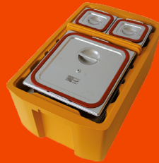
thermoport® 100 K hybrid