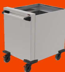
Plattformstapler GN 2/1, unbeheizt