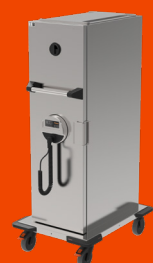
thermoport® 3000 U