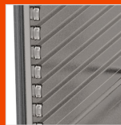
1 H3 Muffel