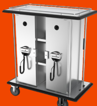
JVA-Transportwagen mit Fach für Getränkebehälter sowie zwei beheizbaren Abteilen

Speisenverteilwagen. Für den sicheren und hygienischen Transport und die Ausgabe sowie zum Kalt- und Warmhalten von JVA-Speisenverteilern. Pro Abteil je 30 Stück Speisenschalen. Einsatzbereich max. +100 °C, digitale Temperaturregelung bis max. +100 °C, optional mit Dachgalerie und Einhängerbord.