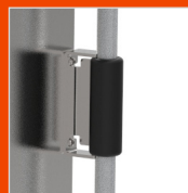
7 Stabile Schiebgriffe