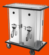
JVA-Transportwagen mit zwei beheizbaren Abteilen