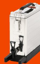
Thermi 7 Liter